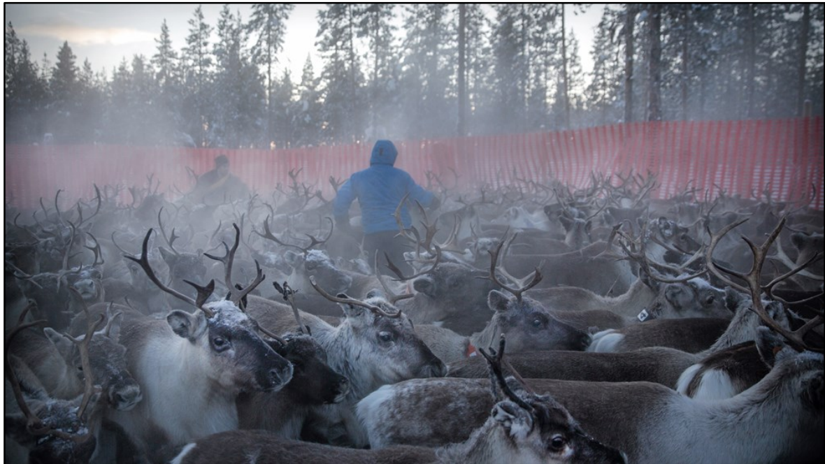
Renskiljning i Jokkmokk i 20 minusgrader. Renarna räknas och delas upp efter ägare.

Det är samernas nationaldag och marknad i Jokkmokk i dag. "Ring så spelar vi" direktsänds från Folkets hus. Samtidigt kommer Svenska kyrkan med en rannsaking av sin historia, om hur kyrkans män öppnade för rasbiologi och skullmätningar, hur renskötarnas barn sorterats ut och fått sämre utbildning.