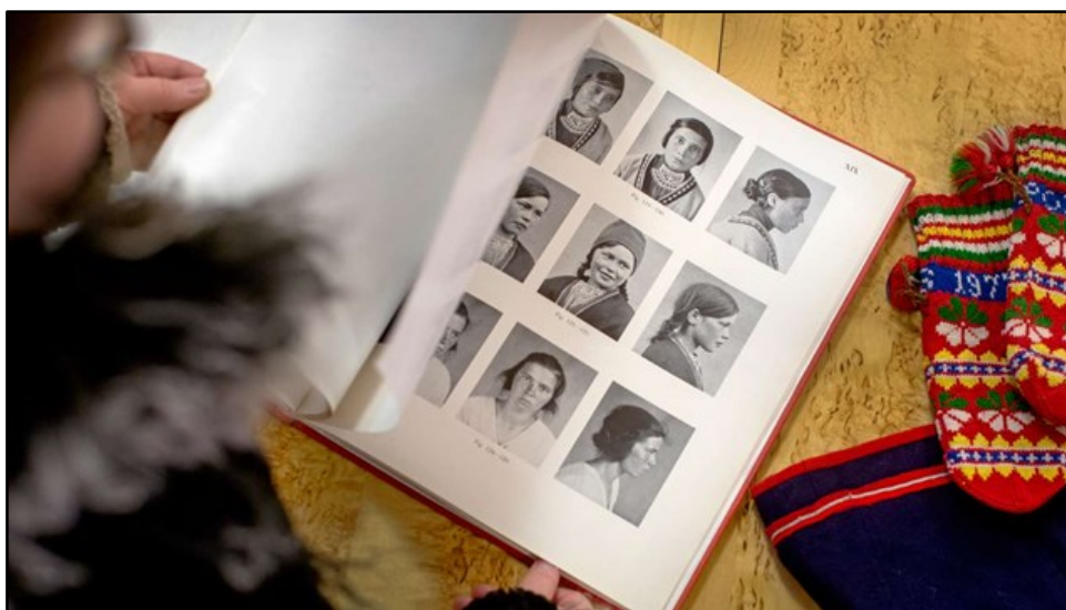
Fotografier insamlade av Herman Lundborg och Statens institut för rasbiologi.

– Samiskan har ju inte fått någon plats i vårt skrivande liv. Jag skriver ju bättre på svenska än på samiska. Så man kan säga att Sverige vann.