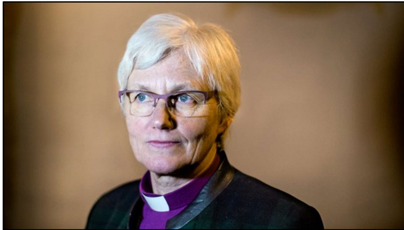
Ärkebiskop Antje Jackelén.